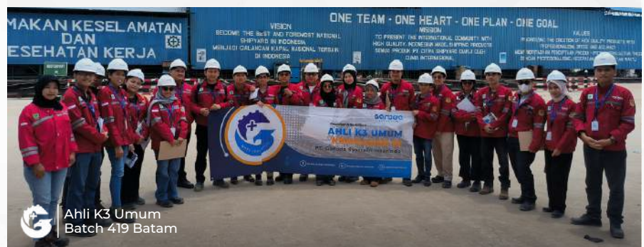
Ahli K3 Umum Batch 419 Batam