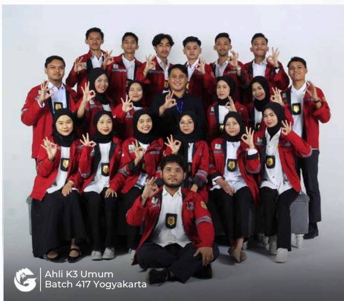
Ahli K3 Umum Batch 417 Yogyakarta