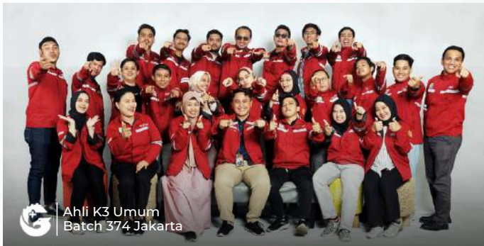
Ahli K3 Umum Batch 374 Jakarta