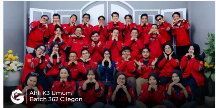
Ahli K3 Umum Batch 362 Cilegon