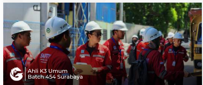
Ahli K3 Umum Batch 454 Surabaya