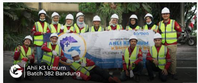
Ahli K3 Umum Batch 382 Bandung