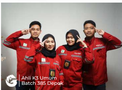
Ahli K3 Umum Batch 385 Depok